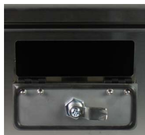
Puerta Gatera para la salida de los cables cuando la caja está cerrada