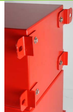
Soportes para instalación trasera