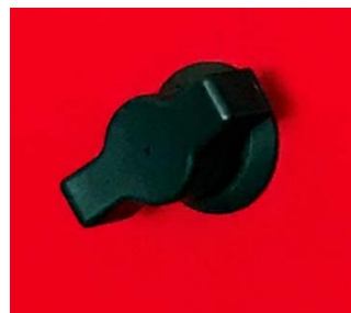
Manecilla para apertura