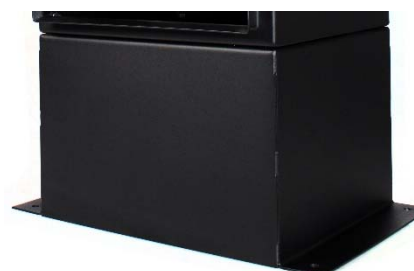
Peana de acero inoxidable

Versión EMC según EEC 89/336 de compatibilidad electromagnética.