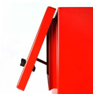
Soporte para puerta